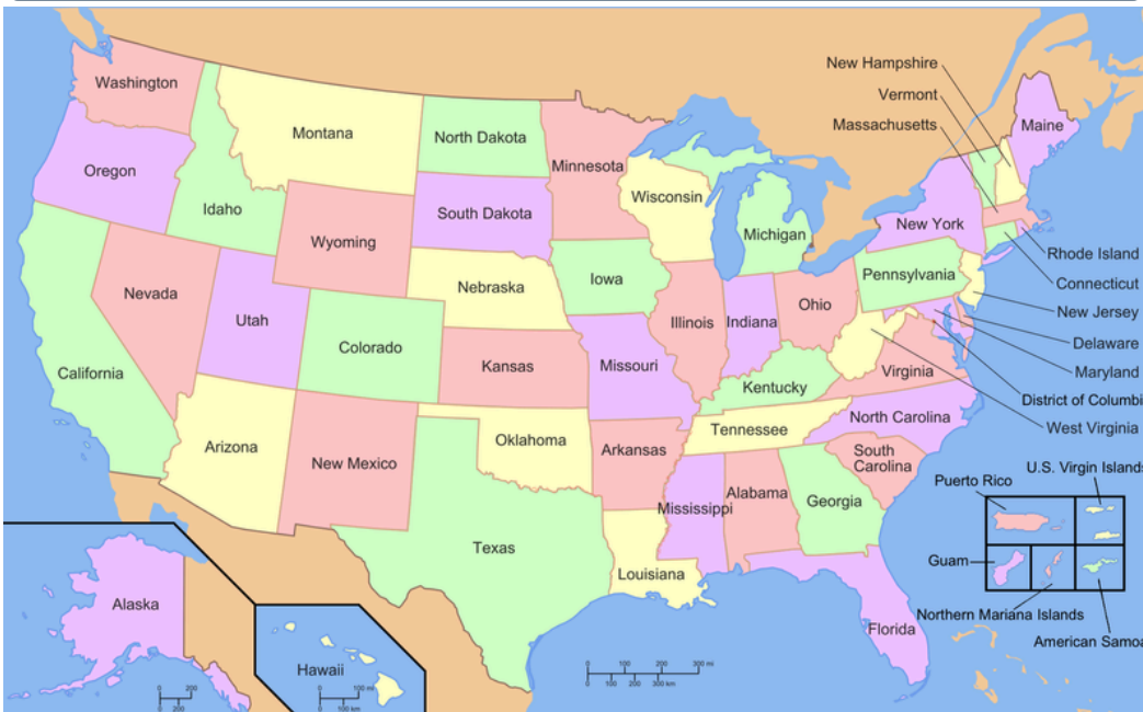
Map of the United States — the 50 states, the District of Columbia, and the 5 major territories